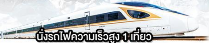
นั่งรถไฟความเร็วสูง 1 เที่ยว