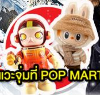
แวะจุ่มที่ POP MART