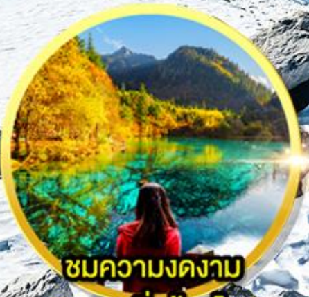
ชมความงดงาม อุทยานจิวจ้ายโกว