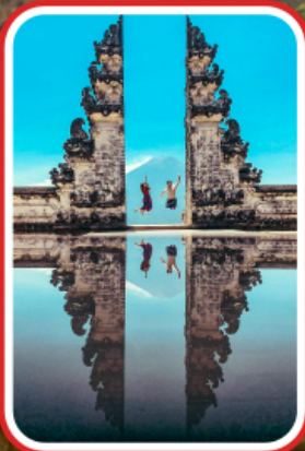
ไฮไลท์แห่งบาห์ลี