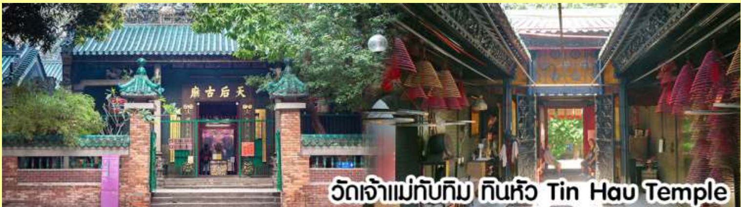
วัดเจ้าแม่ทับทิม ทินหัว Tin Hau Temple

นำทุกท่าน ไหว้ศาลเจ้าแม่ทับทิม ทินหัว (Tin Hau Temple) เป็นวัดเก่าแก่และสำคัญอีกวัดหนึ่งของฮ่องกง เพราะในสมัยก่อนฮ่องกงเป็นเพียงหมู่บ้านชาวประมง ซึ่งเคารพนับถือเจ้าแม่ทับทิมว่าเป็นเทพีแห่งทะเล เพื่อให้เดินทางปลอดภัย เวลาออกไปทำงานไกล ๆ หรือออกหาปลา นอกจากการมาสักการะบูชาเจ้าแม่ทับทิมในเรื่องของการเดินทางให้ปลอดภัยแล้ว ไฮไลท์สำคัญอีกอย่างหนึ่งของ วัดเจ้าแม่ทับทิม ทินหัว (Tin Hau Temple) จะเป็นขดรูปสี่แดงขนาดใหญ่ ที่แขวนอยู่ตามเพดานด้านบนในวิหารของวัดเต็มไปหมด จะยิ่งสวยงามในยามที่มีแสงแดงส่องลงมาเหมือนเป็นลำแสงส่องทะลุวันรูปแปลกตายิ่งนัก ส่วนอาคารของวัดก็จะเป็นสถาปัตยกรรมแบบวัดจีน สร้างขึ้นตั้งแต่ปีค.ศ. 1876 โดยทางเข้าของวัดจะอยู่ติดกับสวนสาธารณะเล็กๆ ที่มีต้นไม้ใหญ่หลายต้น ให้บรรยากาศร่มรื่น