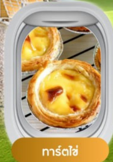
การ์ทไซ้