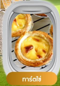
ทาร์ตไข่