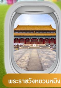
พระราชวังหยวนหมิง