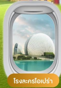
โรงละครโอเปร่า