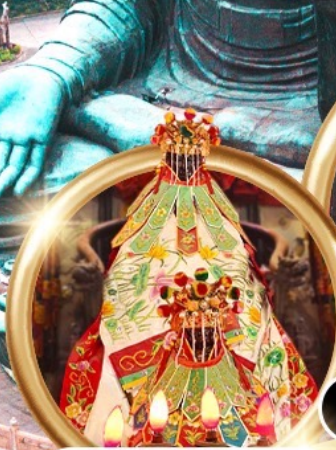
ยืมเงินเจ้าแม่กวนอิมสองย่า