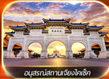
อนุสรณ์สถานเจียงโกเช็ก