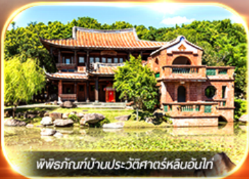
พิพิธภัณฑ์บ้านประวัติศาสตร์หลันอันไท่