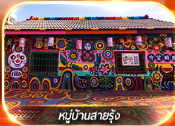
หมู่บ้านสายรุ้ง