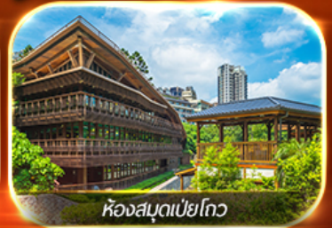
ห้องสมุดเป่ย์โกว

อาลีซาน นั่งรถไฟสายโรแมนติก ช้อปปิ้งจู่โจว ตลาดซีเหมินติง , กลอเลีย เอ้าท์เล็ต ล่องเรือชมทะเลสาบสุริยันจันทรา สะพานคู่รัก ห้องสมุดเป่ย์โกว ถนนโบราณต้นสุ่ย