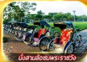
นั่งสามล้อชมพระราชวัง

สัมผัสความสวยงามหมู่บ้านสไตลฝรั่งเศสที่บานาวิลล่า วัดเทียนมู่ พระราชวังเว้ สัมผัสเมืองโบราณฮอยอัน ล่องเรือกระดัง