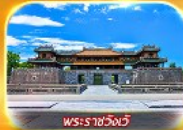
พระราชวังเว้