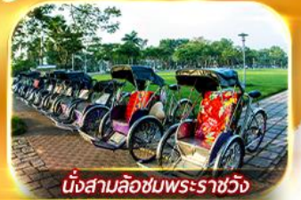
นั่งสามล้อชมพระราชวัง

สัมผัสความสวยงามหมู่บ้านสไตล์ฝรั่งเศสที่บานาวิลล่า วัดเทียนมู่ พระราชวังเว้ สัมผัสเมืองโบราณฮอยอัน ล่องเรือกระดิง