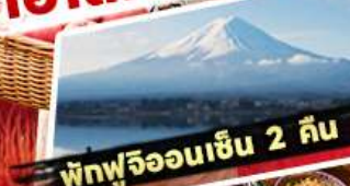
พิทฟูจ็ออนเซ็น 2 ถิ่น