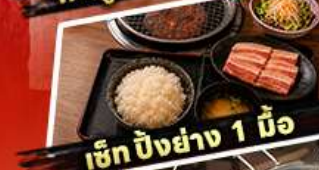
เช็ท บังยั้ง 1 นื้อ