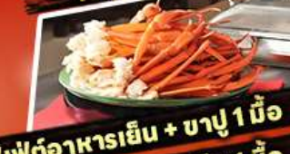
บุฟเฟ่ต์อาหารเย็น + ชาปู 1 นื้อ บุฟเฟ่ต์อาหารเย็น 1 นื้อ