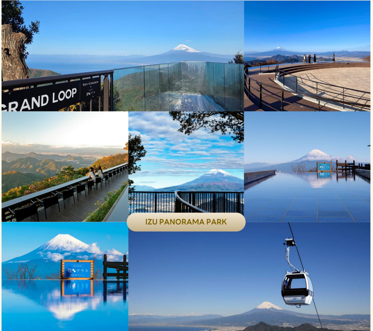
IZU PANORAMA PARK

นำท่านสู่ IZU PANORAMA PARK สัมผัสความตระการตาของการชมภูเขาไฟฟูจิในมุมมองใหม่ เริ่มต้นการเดินทางด้วยการ นั่งกระเช้าไฟฟ้า จากสถานีด้านล่าง ไต่ระดับความสูงชันสู่ยอดเขาดัตสึรากิ (Mount Katsuragi) ที่ความสูง 452 เมตรเหนือระดับน้ำทะเล ดันตาตื่นใจไปกับวิวแบบ 360 องศาตลอดการนั่งกระเช้าประมาณ 7 นาที มองเห็น ตัวเมืองอิซุโนะคุนิ และอ่าวสิรุกะ (Suruga Bay) ที่ลึกที่สุดในญี่ปุ่น โดยมีภูเขาไฟฟูจิเป็นฉากหลังที่สว่างงาม เมื่อถึงยอดเขา ท่านจะพบกับระเบียงไม้ พร้อมโซฟาลอยฟ้า และสระน้ำกระจก ที่สะท้อนเงาทองฟ้ากับฟูจิอย่างสมบูรณ์แบบ (ราคาทัวร์รวมค่ากระเช้า)