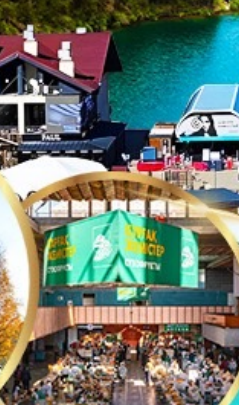
ตลาดกรีนบาร์ชา