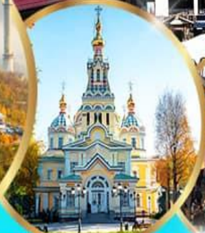
โบสถ์เซนคอฟ