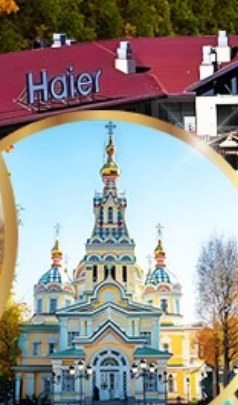
โบสถ์เซนต์คอฟ