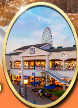
Rinku Premium Outlets