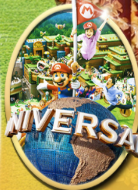
อิสระเลือกซื้อบัตร Universal Studios Japan

ไอโคโน้ พิเศษ! อิสระท่องเที่ยว 1 วันเต็ม