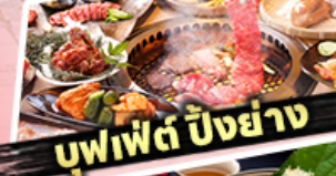
บุฟเฟต์ ปิ้งย่าง