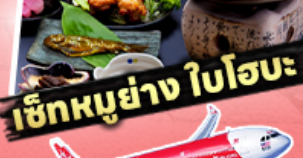
เช็กหมูย่าง ใบโอบะ