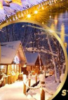
หมู่บ้านเทพนิยาย นิงเกิลเทอเรส