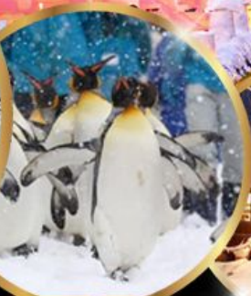
สวนสัตว์ อาซาฮิยาม่า