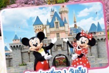
อิสระท่องเที่ยว 1 วันเต็ม