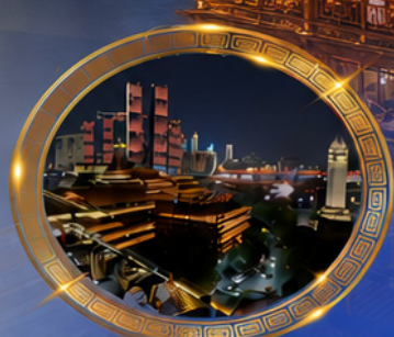
มือค้ำร้านอาหารวิวหลักล้าน ชมแสงสีเมืองลองซิ่ง