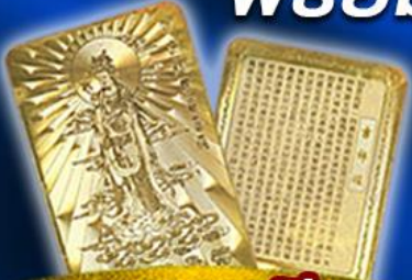
แถมฟรี แผ่นทองเจ้าแม่กวนอิม