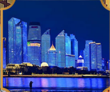
หาดเซเบอร์ฟังก์