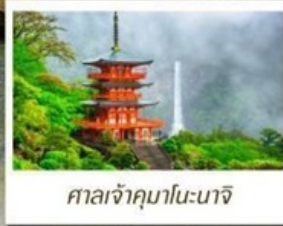
ศาลเจ้าคามาโนะนาจิ