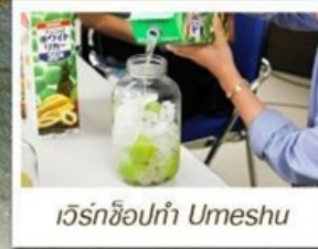
เวิร์กช็อปทำ Umeshu