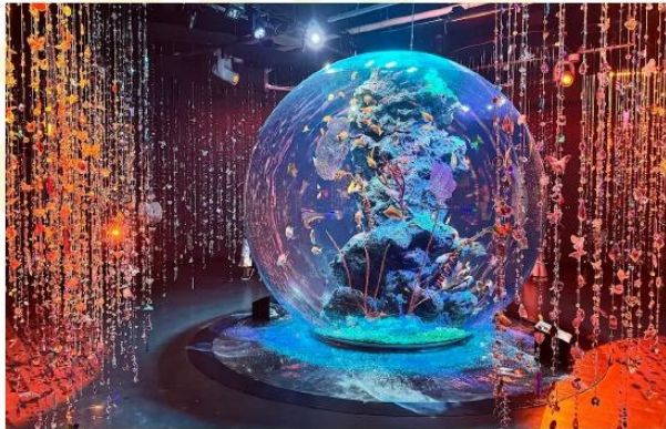
KOBE AQUARIUM ATOA