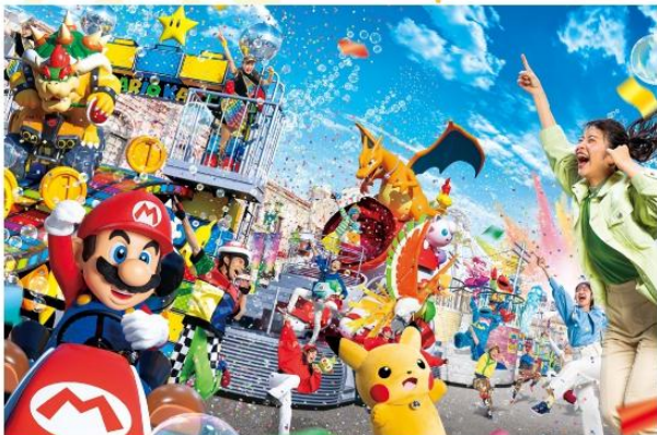
SUPER NINTENDO WORLD

นอกจากนี้ยังมีโซนยอดนิยมอื่นๆ เช่น Minion Park, Jurassic Park, Hollywood, New York และ Amity Village ที่พร้อมมอบความสุขให้กับทุกคนในครอบครัว