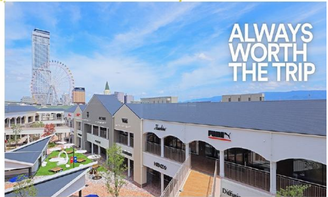
อิสระอาหารกลางวันตามอริยาศัย (รับเงินคืนจากบัตรคูปอง 2,000 เยน)