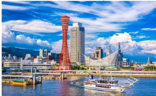
KOBE PORT TOWER