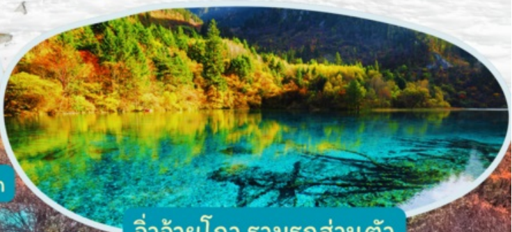
จิวจ้ายโกว รวมรถส่วนตัว