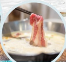
เมนูพิเศษ สุกินม่าล่า