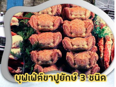
บุฟเฟ่ต์ชาปูยักษ์ 3 ชนิด

บิน Full service สายการบินไทย น้ำหนักกระเป๋า 25 กก.**เที่ยวเต็มทุกวัน อาหารครบทุกมื้อ**