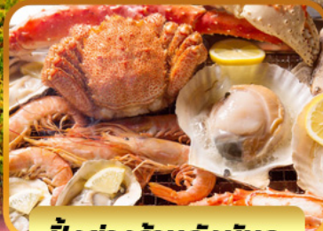
บั้งย่างร้านดังนั้นตะ