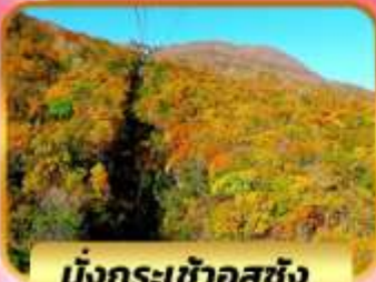
นั่งกระเช้าอุซุซัง