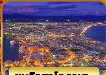
ชมวิวฮาโกดาเตะ