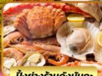
บั้งย่างร้านดังนั้นตะ