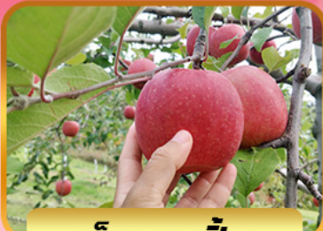
เก็บแอปเปิ้ล