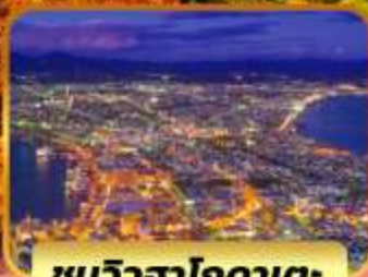
ชมวิวฮาโกดาเตะ