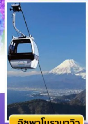
อิซุพาโนรามาวิว