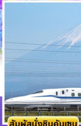
สัมผัสนั่งชินคันเซน