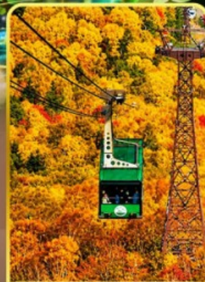
กระเช้าคุโรดากะ