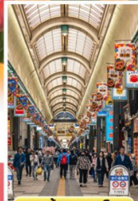
ช้อปปิ้งทานุกิโคจิ