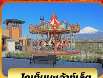
โกเ็มบะเจ้าที่เล็ต