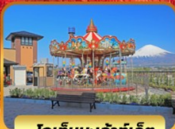
โกเท็มปะเจ้าท์เล็ด