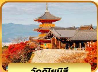
วัดคิโยมิสึ