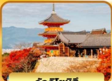
วัดคิโยมิตสึ