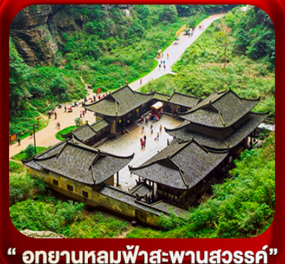
“ อุทยานหลุมฟ้าสะพานสวรรค์ ”