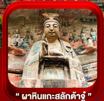
“ ผาหินแกะสลักต้าจู้ ”

บินตรงลงธงชิง • อุ๋หลง หลุมฟ้าสะพานสวรรค์ • ระเบียงแก๊ว • อุทยานเขานางฟ้า หงหยาดัง • นิ่งรถไฟคะลุดัก • ศาลาประชาม (ด้านนอก) • หลงหมินฮ่าว มรดกโลกผาหินแกะสลักต้าจู้ • วัดหลิวฮั่น • ตึกตะเกียบ • หมู่บ้านโบราณสี่ซีโหว่