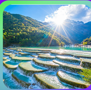
“ทะเลสาบโป๋ส่วยเหอ”