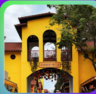
“หมาหยวนมิเตอร์กจ”