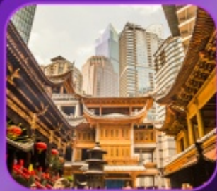
"วัดหลิวซัน"