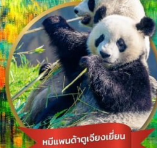
หมีแพนด้าเจียงเยียน