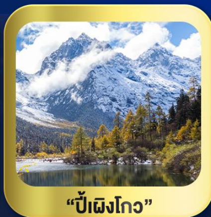
“ปี้ผิงโกว”