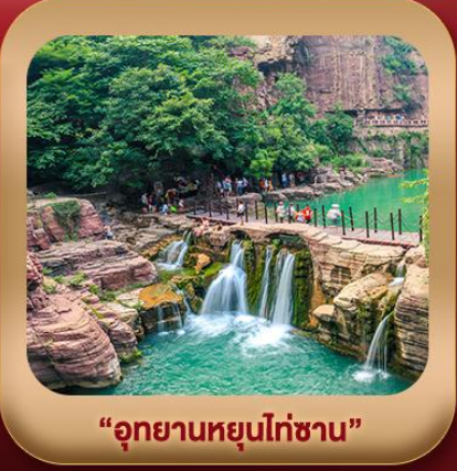
“อุทยานหยุนไต้ซาน”

ชมถ้ำหลงเหมิน มรดกโลกที่เมืองลั่วหยาง • สุสานจิ้นซีฮ่องเต้ • ศาลาเจ้ากวนอู วัดเส้าหลิน + ป่าเจดีย์ + ชมโชว์กังฟู • เมืองโบราณลั่วอี้ • อุทยานหยุนไต้ซาน เจดีย์ห่านป่าใหญ่ • ถนนวัฒนธรรมต้าถัง • ถนนคนเดินอิสลาม • จัตุรัสหอระบิง