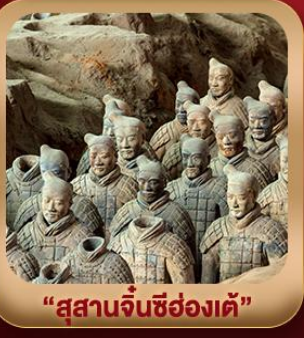
“สุสานจิ้นซีฮ่องเต้”