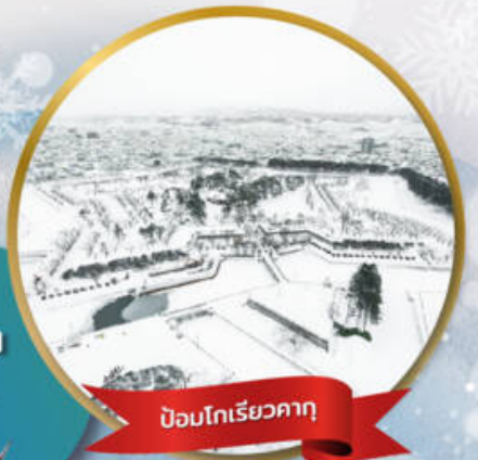
ป้อมโทริเยวคาคุ