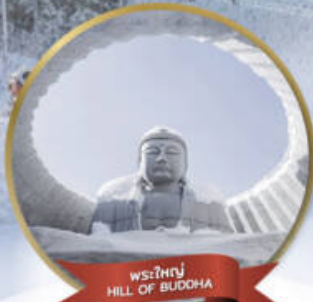
พระใหญ่ HILL OF BUDDHA