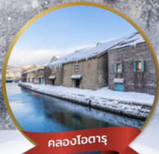
คลองโอดารุ