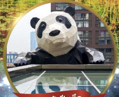
แพนด้ายักษ์

มหัศจรรย์ความงาม อุทยานจิวจ้ายโกว (รวมรถเหมาเที่ยวอุทยานเต็มวัน) ชมอุทยานหวงหลง (รวมกระเช้า) • สีดรุณี • อุทยานของเจียวโกว (รวมรถอุทยาน) เมืองเก่าชงพาน • ถนนคนเดินจิมหลี่ + ไถ่กูหลี่ • ชมแพนด้ายักษ์ป็นตึก