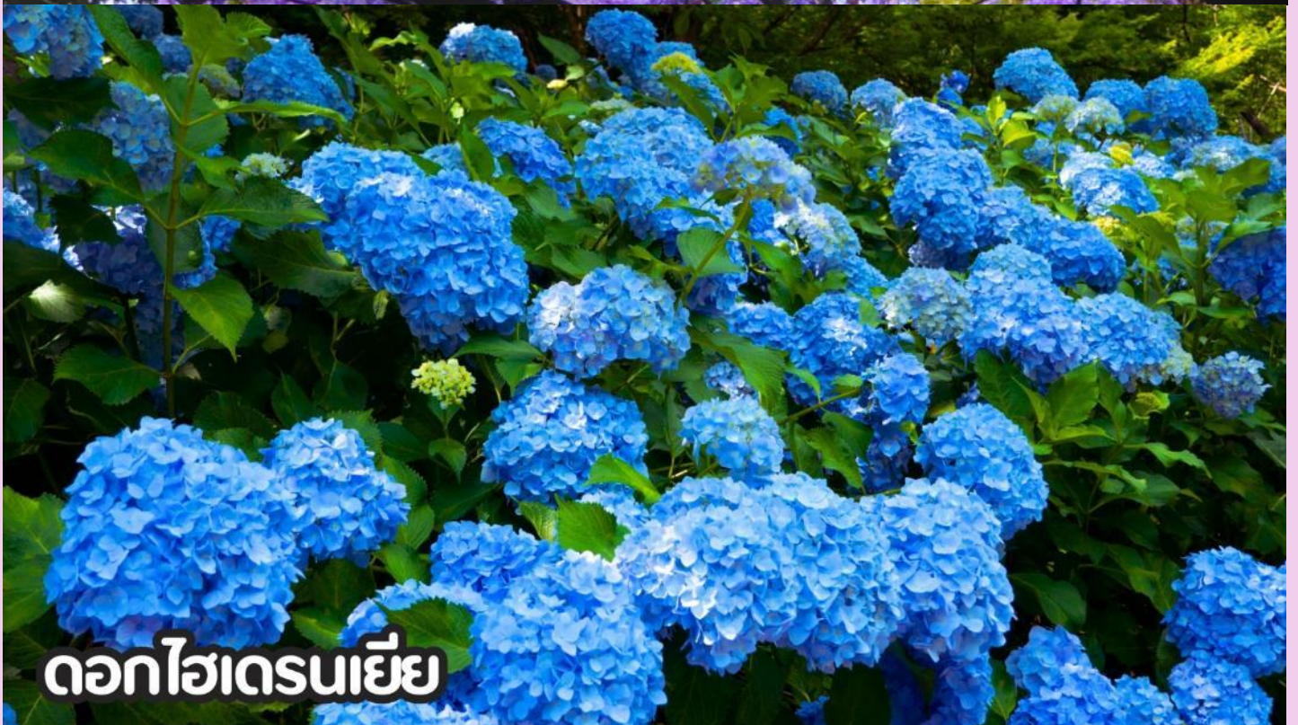
ดอกไฮเดรนเยีย

**หมายเหตุ: โปรแกรมชมดอกไม้ช่วงเดือน พ.ค. - ต.ค.2569 ในช่วง ณ วันเดินทางดังกล่าว หากดอกไม้ยังไม่บานหรืออาจจะร่วงหล่น..ทั้งนี้ขึ้นอยู่กับสภาพอากาศของแต่ละปี ทางบริษัทไม่การันตี และไม่สามารถกำหนดการบานของดอกไม้ได้ ทางบริษัทฯ ขอสงวนสิทธิ์ปรับเปลี่ยนรายการท่องเที่ยวอื่นทดแทนนะคะ รบกวนท่านโปรดทราบและทำความเข้าใจค่ะ**