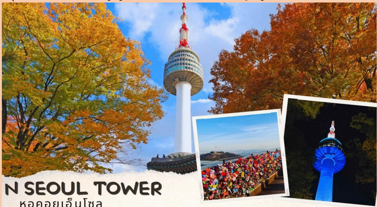
N SEOUL TOWER หอคอยเอ็นโซล

WATER DROP (ครีมหน้าแตก) , SNAIL CREAM (ครีมเมือกหอยทาก) , BOTOX (โบท็อกซ์) , ALOE VERA PRODUCT (ผลิตภัณฑ์จากสมุนไพร ว่านหางจระเข้) เป็นต้นหลังทานอาหารเย็น จากนั้นนำท่านสู่ หอคอยกรุงโซล N Tower (ไม่รวมค่าลิฟต์) ซึ่งอยู่บริเวณเนินเขานัมซานซึ่งเป็น 1 ใน 18 หอคอยที่สูงที่สุดในโลกที่ฐานของหอคอยมีสิ่งที่น่าสนใจต่างๆเช่นศาลาแปดเหลี่ยมपालก๊กจอง, สวนสัตว์เล็ก ๆ, สวนพฤกษชาติ, อาคารอนุสรณ์ผู้รักชาติอันซุงกุน อีสระให้ทุกท่านได้เดินเล่นและถ่ายรูปคู่หอคอยตามอัธยาศัยหรือคล้องกัญแจคูรั๊ก