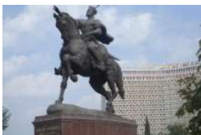
จัตุรัสอามิร์ ตีมูร์