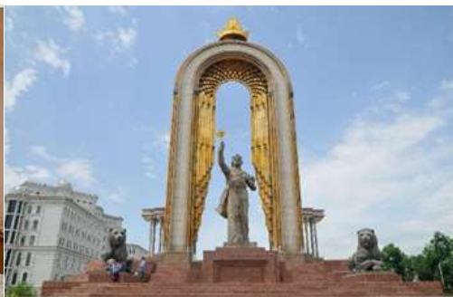
อนุสาวรีย์อิสมาอิล ซามานี