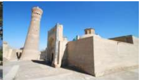
หอโพลี คัลยาน