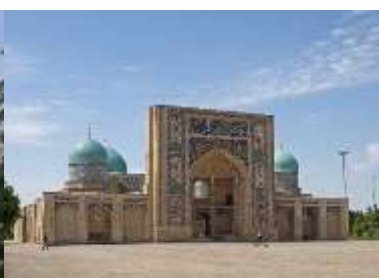
Hazrati Imam Complex