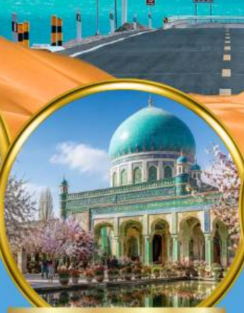
สุสานสมหอมเซียนเฟย