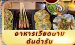
อาหารเวียดนาม ต้นตำรับ