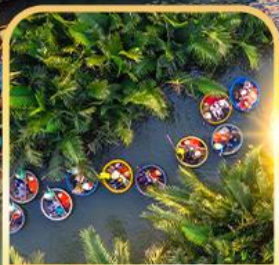
นั่งเรือกระด้ง