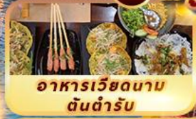
อาหารเวียดนาม ต้นตำรับ