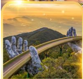
สะพานมือยักษ์