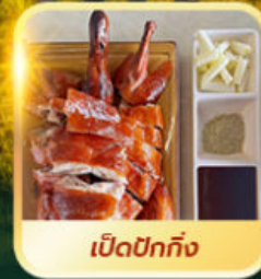
เปิดปีกกิ้ง