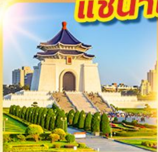
อนุสรณ์เจียงไคเช็ค

นั่งรถไฟปองปอง! ชมวิวที่ผิงซาน แช่น้ำแร่ร้อนตัวในห้องพัก