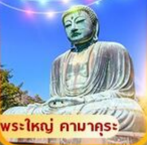
พระใหญ่ คามาคุระ

01 - 05 พ.ย. 67 12 - 16 พ.ย. 67 29 พ.ย. - 3 ธ.ค. 67 06 - 10 ธ.ค. 67 13 - 17 ธ.ค. 67 20 - 24 ธ.ค. 67 24 - 28 ธ.ค. 67