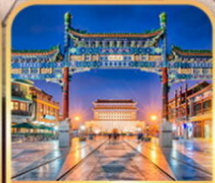
ถนนเจียนเหมิน