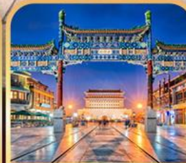
ถนนเทียนเหมิน