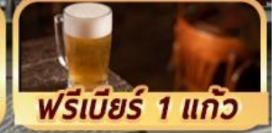
ฟรีเบียร์ 1 แก้ว