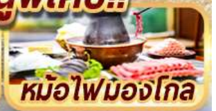
หม้อไฟมองโกล