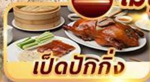
เป็ดปักกิ่ง