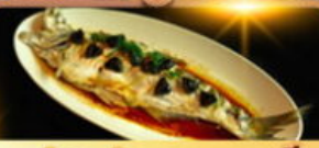
ปลาประรานาบดี