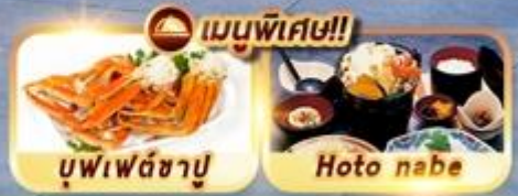
เมนูพิเศษ!!