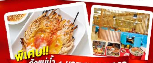
พิเศษ!! ก๊วยแม่น้ำ + HOTPOT SEAFOOD