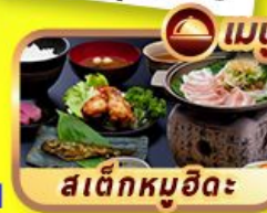
สเด็กหมูฮิดะ