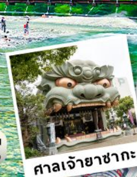
ศาลเจ้ายาซากะ