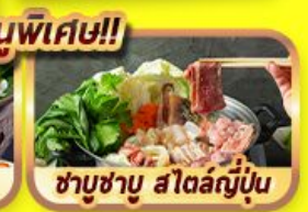
ชาบูชาบู สโตล์ญี่ปุ่น