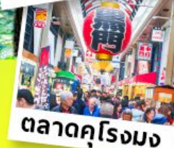
ตลาดคุโรมง