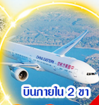
บินภายใน 2 ชม