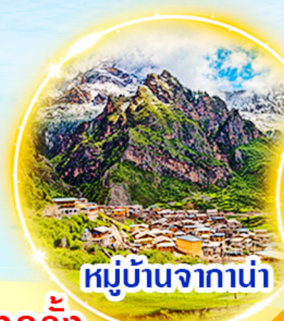
หมู่บ้านจากาน่า